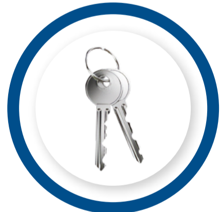
LLAVES MANUALES Manual keys