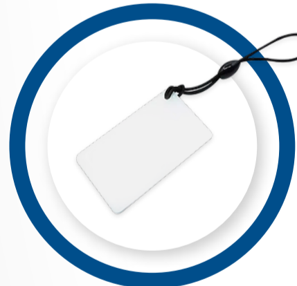
TARJETA DIGITAL Digital card