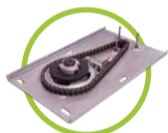
Sistema de transmisión