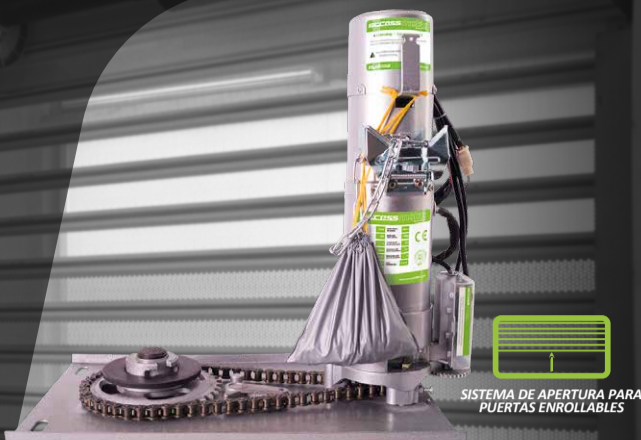
SISTEMA DE APERTURA PARA PUERTAS ENROLLABLES

3 years limited warranty años de garantía limitada